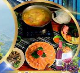
ซาบูหม่อโพลาสเตอเรียน + ไวน์แดง