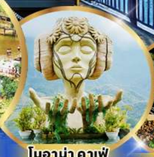
โมนาน่าคาเฟ่