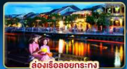
ส่องเรือลอยกระทง