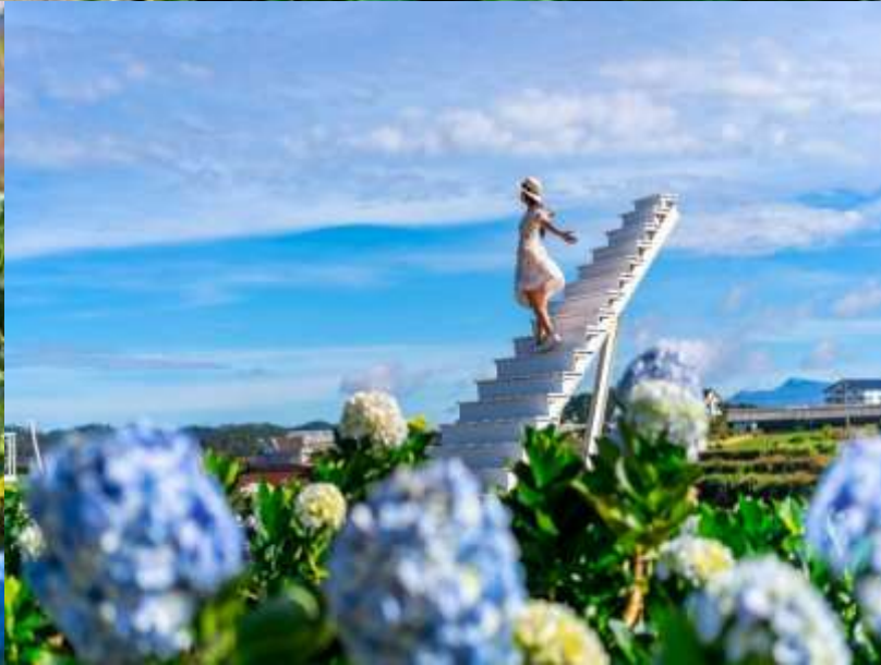
WVN130411-FD เรียบดินนามใต้ ญาจาง ดาลัด มุยนเ่ โสจิมินท์ 4D3N