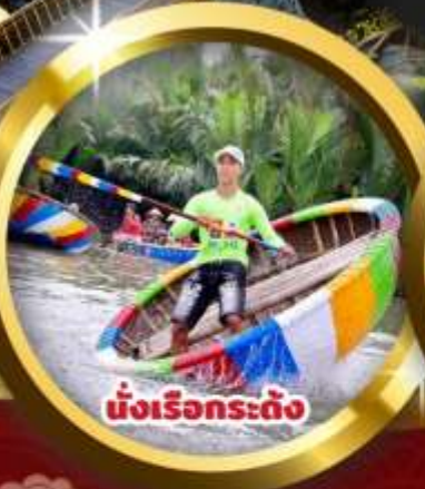
นั่งเรือกระดิ่ง