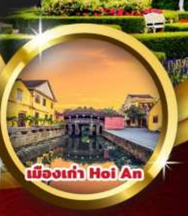
เมืองเก่า Hoi An