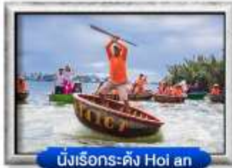
นั่งเรือกระดิง Hoi an