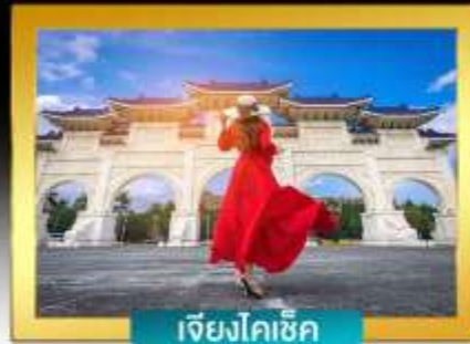
เจียงโคเช็ก