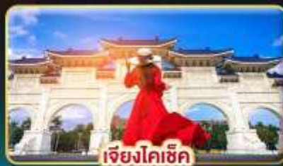
เจียงไคเช็ก