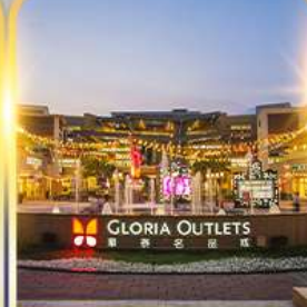
กลอเรีย เอาท์เล็ต