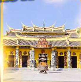
วัดซอพรเทพเจ้า