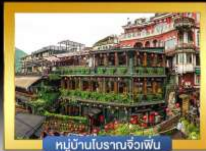
หมู่บ้านโบราณจิวเฟิน