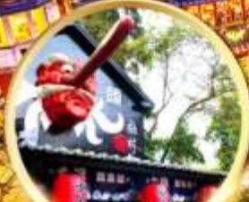
หมู่บ้านปัสสาวะชิวโกว