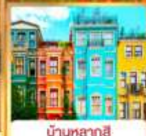
บ้านหลากสี คิสเลอร์ฟู