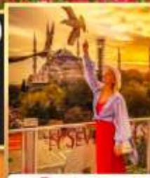
ลู่ฟือปไซเวนฮิลล์ส