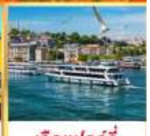
เรือเฟอร์รี่

เที่ยวครบเส้นทางยอดนิยม บินเข้าถึงเย็น เช้าชมสุเหร่ายักษ์คามลิก้า และล่องเรือเฟอร์รี่ ชมเทศกาลทิวลิปแห่งนครอิสตันบูล