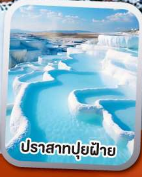
ปราสาทปุยฝ้าย