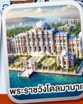
พระราชวังโดลมาบาเซ่