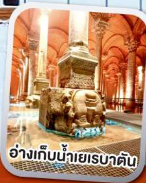
อ่างเก็บน้ำเยเรบาตัน