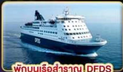
พักบนเรือสำราญ DFDS