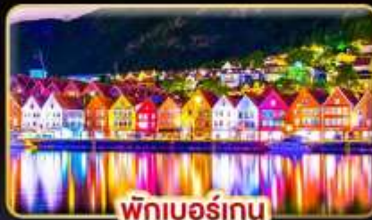
พักเบอร์เกน