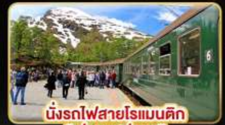
นั่งรถไฟสายโรแมนติก “ฟรอมสปาน่า”