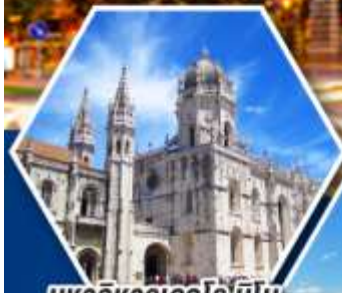
มหาวิหารเจโรนิโม