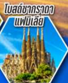
โบสถ์ซากราดา แฟมิเลีย