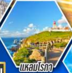
แควมโรกา