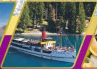
ส่องเรือกลไฟโบราณ อาหารแบบ BBQ ที่วอลเตอร์ฟิค ฟาร์ม