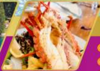
คุ้งมิงกร์ท่านละครั้งต่อ