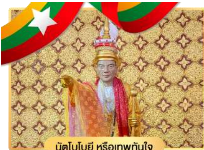
นัตโบโบยี หรือเทพทันใจ

จากนั้นนำท่านข้ามฝั่งไปอีกฟากหนึ่งของถนน เพื่อสักการะ เทพกระซิบ ซึ่งมีนามว่า “อะมาดอร์เมียร์” ตามตำนานกล่าวว่า นางเป็นธิดาของพญานาค ที่เกิดศรัทธาในพุทธศาสนาอย่างแรงกล้า รักษาศีล ไม่ยอมกินเนื้อสัตว์จนเมื่อสิ้นชีวิตไปกลายเป็นนัต ซึ่งชาวพม่าเคารพกราบไหว้กันมานานแล้ว ซึ่งการขอพรเทพ กระซิบต้องไปกระซิบเบาๆ ห้ามคนอื่นได้ยิน ชาวพม่านิยมขอพรจากเทพองค์นี้กันมากเช่นกัน การบูชาเทพ กระซิบ บูชาด้วยน้ำนม ข้าวตอก ดอกไม้ และผลไม้