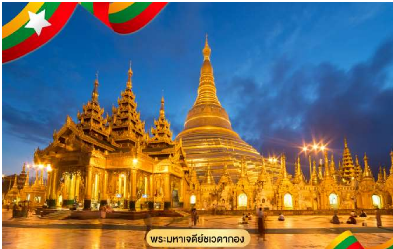
พระมหาเจดีย์ชเวดากอง

มีตำนานและภูมิหลังความเป็นมาทั้งสิ้น ชมระฆังใบใหญ่ที่อังกฤษพยายามจะเอาไปแต่เกิดพัดตกแม่น้ำ อย่างกุ่มเสียก่อนอังกฤษกู้เท่าไรก็ไม่ขึ้นภายหลังชาวพม่า ช่วยกันกู้ขึ้นมาแขวนไว้ที่เดิมได้ จึงถือเป็น สัญลักษณ์แห่งความสามัคคีซึ่งชาวพม่าถือว่าเป็นระฆังศักดิ์สิทธิ์ ให้ตีระฆัง 3 ครั้งแล้วอธิษฐานขออะไรก็ จะได้ดังต้องการ จากนั้นให้ท่านชมแสงของอัญมณีที่ประดับบนยอดฉัตรโดยจุดชมแต่ละจุดท่านจะได้เห็น แสงสีต่างกันออกไป เช่น สีเหลือง, สีน้ำเงิน, สีส้ม, สีแดง เป็นต้น