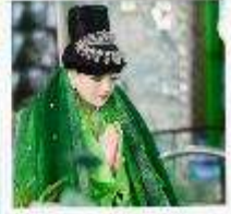
เทพกระซิบ