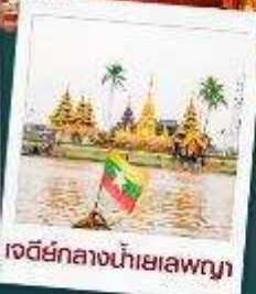
เจดีย์กลางน้ำเยเลพญา