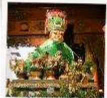
ขอพรแม่ย่า

สักการะ 3 มหาบูชาสถาน ที่สุดแห่งศรัทธาของชาวพุทธ