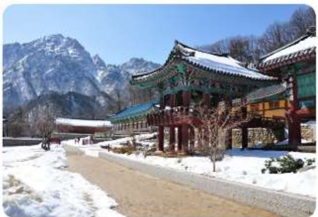
แห่งนี้ได้