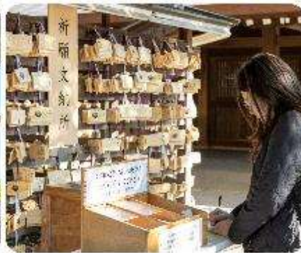
ศาลเจ้าเมจิจิงกู

ศาลเจ้าเมจิ หนึ่งในสถานที่อันศักดิ์สิทธิ์ใจกลางกรุงโตเกียว สิ่งแรกที่จะทำให้คุณประทับใจคือการเดินผ่านเสาโทริอิขนาดใหญ่ ระหว่างทางมีธรรมชาติที่ทำให้รู้สึกเหมือนก้าวเข้าสู่อีกโลกหนึ่ง ที่เต็มไปด้วยความสงบ อีกทั้งยังสามารถเขียนคำอธิษฐานลงบนแผ่นไม้ "เอมะ" เพื่อขอพรสำหรับความสุขและความสำเร็จในชีวิตอีกด้วย จากนั้นนำพาทุกท่าน... ซุปปังกันต่อใจกลางกรุงโตเกียว เมืองที่เป็นศูนย์กลางของแฟชั่นและนวัตกรรม และเปิดประสบการณ์การซูปปังที่ไม่เหมือนใคร! สักรวดย่านต่าง ๆ ที่แต่ละแห่งที่มีเสน่ห์และเอกลักษณ์อันโดดเด่น เมืองที่เต็มไปด้วยชีวิตชีวาและความทันสมัยที่หลากหลายอย่าง ย่านฮาราจุกุ แหล่งรวมแฟชั่นที่แปลกใหม่และสดใส เดินเล่นบน Takeshita Street ที่เต็มไปด้วยเสื้อผ้าและเครื่องประดับที่ไม่ซ้ำใคร เพลิดเพลินกับบรรยากาศสุดคูลที่เป็นเอกลักษณ์