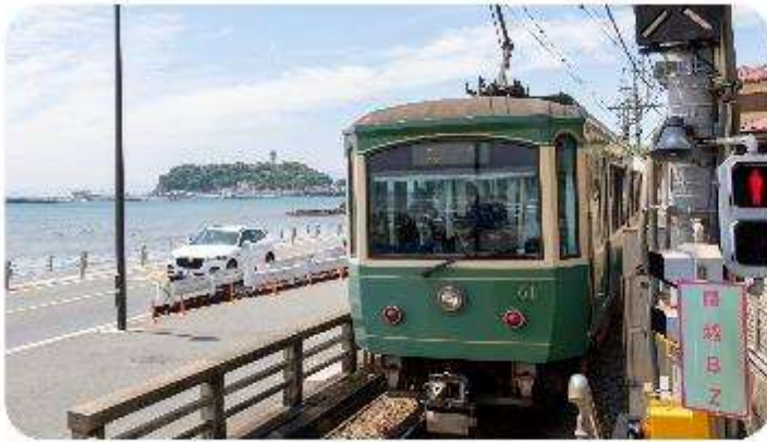
เมืองคามาคุระ