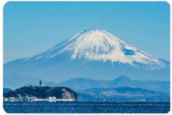
เกาะเอโนะชิมะ

เมืองคามาคุระ (Kamakura) เมืองน่ารักติดทะเล ตอบโจทย์ที่เที่ยวที่ผสมผสานระหว่างประวัติศาสตร์ ธรรมชาติ และความงามของทะเล บอกเลยใครมาต้องตกหลุมรักกับเมืองสุดชิล อย่าง คามาคุระ เมืองเล็กๆ ที่ตั้งอยู่ทางตอนใต้ของจังหวัดคานากาวะ ห่างจากโตเกียวเพียงแค่ 1 ชั่วโมง เท่านั้น แต่เต็มไปด้วยสถานที่ท่องเที่ยว ทิวทัศน์ธรรมชาติ และชายหาดที่งดงาม ที่นี้จะทำให้ทุกคนรู้สึกเหมือนได้ย้อนกลับไปสัมผัสประวัติศาสตร์ญี่ปุ่นในยุคซามูไร พร้อมทั้งได้ผ่อนคลายท่ามกลางบรรยากาศที่เงียบสงบและสดชื่น