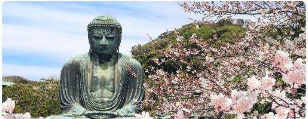
พระใหญ่ไดบุทสึ วัดโคโตคุอิน

จุดเด่นแห่งเมืองนี้คือ พระพุทธรูปองค์ใหญ่ไดบุทสึ (Daibutsu) หนึ่งในสัญลักษณ์ที่โดดเด่นที่สุดของ Kamakura พระพุทธรูปบรอนซ์ขนาดมหึมาที่วัดโคโตคุอิน (Kotoku-in) ที่มีความสูง 13.35 เมตร หนึ่งในพระพุทธรูปที่ใหญ่ที่สุดในญี่ปุ่น ไฮไลท์ของที่นี่คือการได้ชมความงดงามที่ตัดกันระหว่างพระพุทธรูปไดบุทสึขนาดใหญ่และต้นซากุระ ซึ่งปลูกอยู่ทั้งด้านหน้าและด้านหลังของพระพุทธรูป ทำให้เหมาะอย่างยิ่งกับการเดินเล่นและชมซากุระในบริเวณวัด เป็นอีกหนึ่งสถานที่ที่ต้องมาเยือนสักครั้ง หนึ่งในจุดไฮไลท์ของเมืองคามาคุระคือ ไม่น่าไกลกันพาเยือน เกาะเอโนชิมะ (Enoshima) เป็นเกาะที่ตั้งอยู่ในจังหวัดคานากาวะ ประเทศญี่ปุ่น ซึ่งเป็นจุดหมายท่องเที่ยวยอดนิยมที่มีทิวทัศน์สวยงามและสถานที่ที่น่าสนใจมากมาย ทั้งชายหาดสวย และวิวทะเลที่งดงาม ในวันที่ท้องฟ้าโปร่งใสเรายังสามารถมองเห็นวิวของภูเขาไฟฟูจิได้อีกด้วย ด้านบนยังมี ศาลเจ้าเอโนชิมะ ที่มีความสำคัญในด้านความโชคดี โดยเฉพาะในเรื่องความรัก นอกจากนี้ยังมี หอคอยประภาคารเอโนชิมะ ที่ให้ทัศนียภาพ 360 องศา ของเมืองคามาคุระได้อีกด้วย