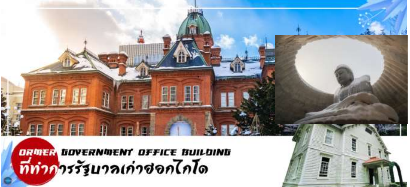
FORMER GOVERNMENT OFFICE BUILDING ที่ทำการรัฐบาลเก่าซอกไกโด

เดินทางสู่ เนินพระพุทธเจ้า (Hill of Buddha) (ใช้เวลาเดินทางประมาณ 1 ชั่วโมง) ตั้งอยู่ทางเหนือของซัปโปโร เป็นผลงานชิ้นเอกอีกชิ้นหนึ่งของทาดาโอะ อันโดะ (Tadao Ando) สถาปนิกชาวญี่ปุ่นเจ้าของรางวัลพริตซ์เกอร์ โดยมีลักษณะเป็นเนินเขาล้อมรอบรูปปั้นพระพุทธรูปมีความสูงมากถึง 13.5 เมตรและมีน้ำหนัก 1500 ตัน พื้นที่ที่ล้อมรอบจะมีค่อยๆลาดลง อีกทั้งรายล้อมด้วยธรรมชาติอันงดงาม สามารถชมในวิวทิวทัศน์ที่แตกต่างกันทุกฤดู ไม่ว่าจะเป็นช่วงฤดูใบไม้ผลิที่จะเต็มไปด้วยต้นไม้นิเวศวิทยาแลดูร่มรื่นเย็น ช่วงฤดูร้อนที่จะแวดล้อมได้สีม่วงของต้นลาเวนเดอร์ และช่วงฤดูหนาวที่เหมือนอยู่ท่ามกลางความขาวสะอาดของหิมะที่ขาวโพลน อีสระให้ท่านชื่นชมความงามของสถานที่แห่งนี้และสัมผัสพุทธศาสนาในมุมมองที่ต่างจากเดิม !!! ไฮไลท์ Unseen Hokkaido ที่เมื่อเดินไปจนถึงจุดที่ประดิษฐานพระพุทธรูปที่อยู่บริเวณปลายทางของอุโมงค์แล้วมองย้อนขึ้นไป จะมองเห็นเหมือนมีแสงสะท้อนอยู่รอบองค์พระพุทธรูปเปรียบเสมือนรัศมีแสงแห่งฟ้า จากนั้นนำท่านช้อปปิ้ง มิตซูบิชิเอาท์เล็ตพาร์ค ซัปโปโร คิตะฮิโรชิมะ (Mitsui Outlet Sapporo Kitahiroshima) (ใช้เวลาเดินทางประมาณ 30 นาที) ซึ่งเป็นเอาท์เล็ตพาร์คขนาดใหญ่สามารถเพลิดเพลินกับการช้อปปิ้งสินค้าแบรนด์เนม ทั้งเสื้อผ้าผู้หญิง ผู้ชาย เด็ก กระเป๋า รองเท้า และมีร้านอาหารมากมาย ที่นี่มีศูนย์อาหารขนาดใหญ่ที่มีจำนวนกว่า 650 ที่นั่งมีเมนูอาหารที่หลากหลายได้เฉพาะที่ซอกไกโดมากมาย อาทิ ข้าวหน้าอาหารทะเล, ไคเซ็นดัง และบุตงเตงอาหารขึ้นชื่อของโทคะชิ แซมเบอเกอร์ทำจากเนื้อวัววากิวซอกไกโด เป็นต้น นอกจากนี้ยังมีสินค้าเกษตรจากท้องถิ่นและสินค้าขึ้นชื่อของซอกไกโดที่ท่านสามารถเลือกซื้อกลับไปเป็นของฝาก ที่ผู้ได้รับจะต้องถูกใจแน่นอน