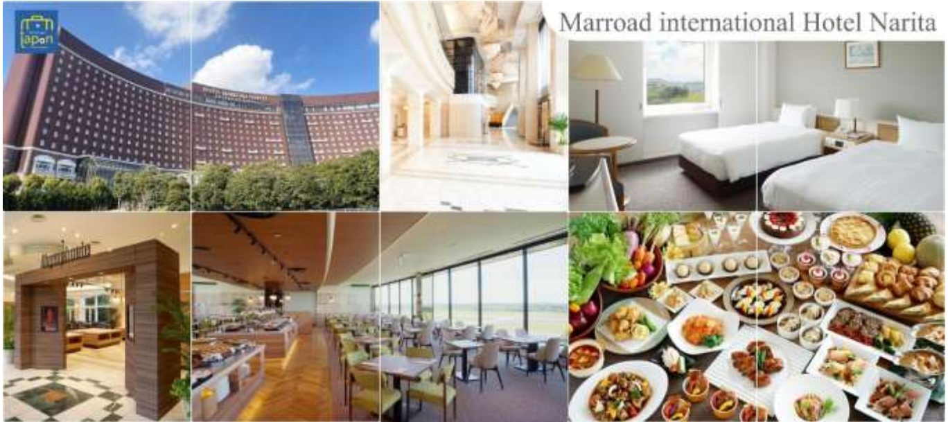
Marroad international Hotel Narita