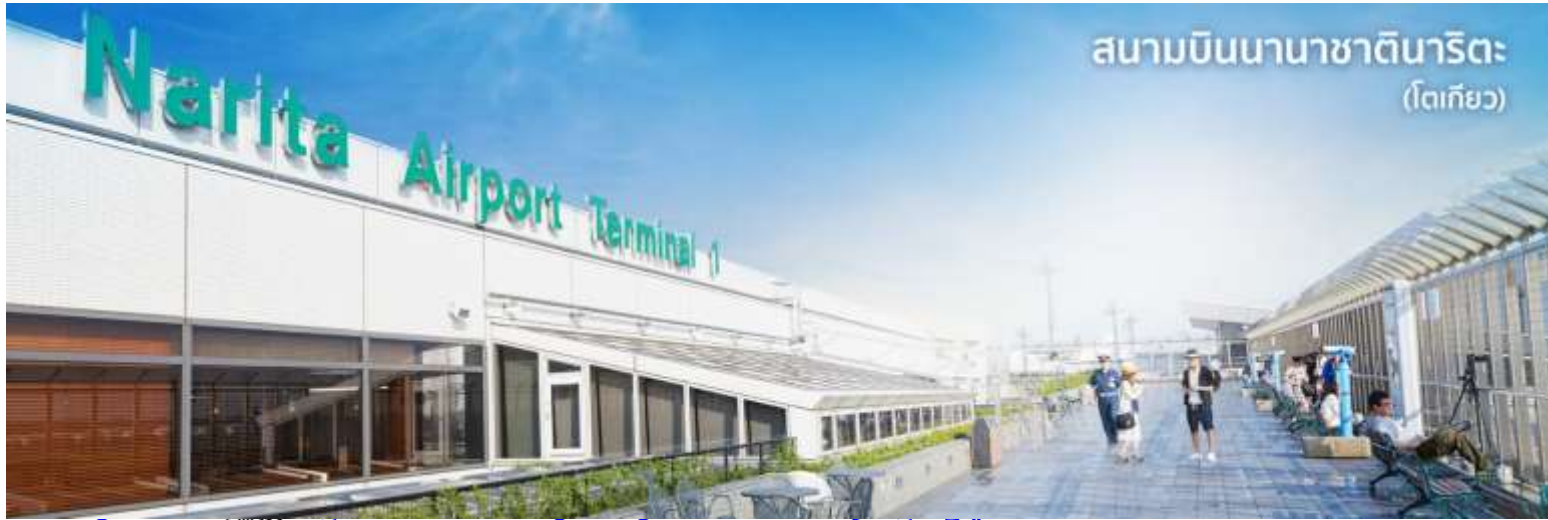
สนามบินนานาชาตินาริตะ (โตเกียว)

10.55 น. เดินทางถึง ท่าอากาศยานนานาชาตินาริตะ ประเทศญี่ปุ่น (เวลาที่ประเทศญี่ปุ่นจะเร็วกว่าประเทศไทย 2 ชม. ควรปรับนาฬิกาของท่านเพื่อสะดวกในการนัดหมาย) นำท่านผ่านขั้นตอนการตรวจคนเข้าเมืองและศุลกากร พร้อม ตรวจเช็คสัมภาระ เรียบร้อยแล้ว สำคัญมาก!! ประเทศญี่ปุ่นไม่อนุญาตให้นำอาหารสด เนื้อสัตว์ พืช ผัก ผลไม้ เข้าประเทศ หากฝ่าฝืนมีโทษปรับและจับ