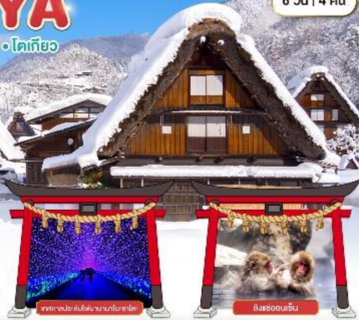
ภาพทิวทัศน์หมู่บ้านนากาโนะ ซาโตะ