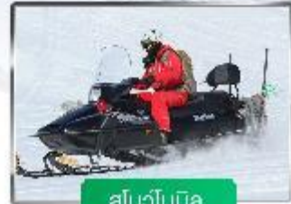
สโนว์โมบิล