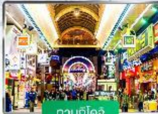
ทานุกิโคจิ