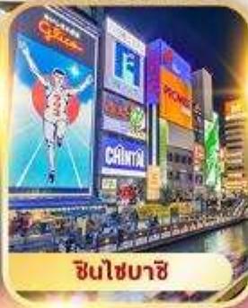
ชินโซบาชิ