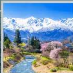
"HAKUBA OIDE PARK"