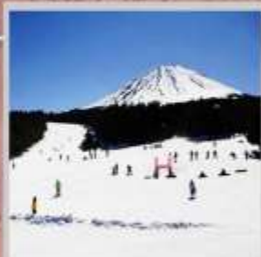
"FUJITEN SNOW PARK"