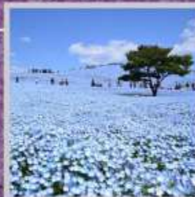
"HITACHI SEASIDE PARK"