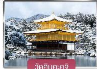
วัดคินคะคุจิ