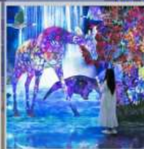
"TEAM LAB FOREST"