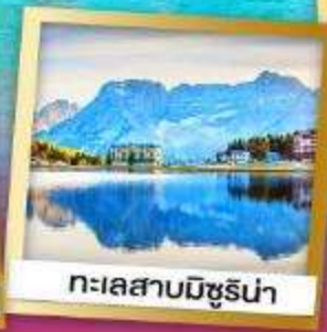
ทะเลสาบมิซูรีน่า