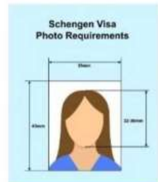
ตัวอย่างรูปถ่าย