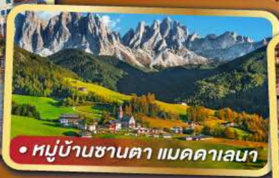
• หมู่บ้านซานตา แมดดาเลนา