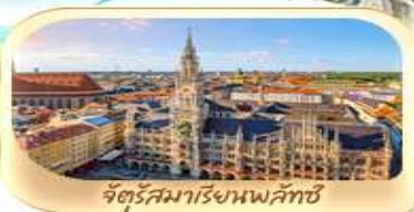
จัตุรัสมาเรียนพลัทซ์