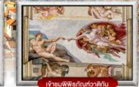
เข้าชมพิพิธภัณฑ์วาติกัน

เมนูพิเศษ! สปาเกตตี้เส้นหมึกดำ, พิชซ่าสไตล์อิตาลีเย็นแท้