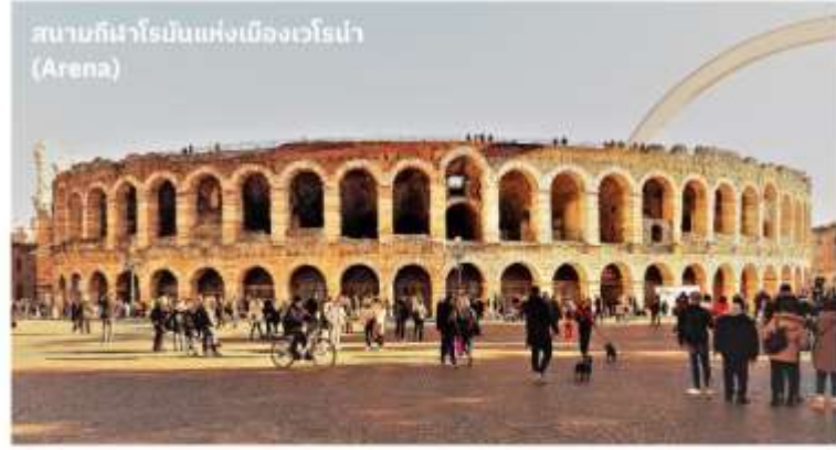
สนามกีฬาโรมันแห่งเมืองเวโรน่า (Arena)