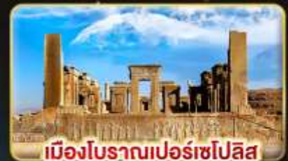
เมืองโบราณเปอร์เซโปลิส

✈️ บินตรง กรุงเทพฯ - เตหะราน บินภายใน ชีราซ - เตหะราน