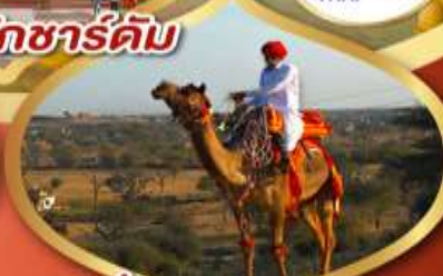
ฟรี ژیู่ซู เมืองมันทอวา ราคาเริ่มต้น