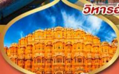
พระราชวัง สายลม