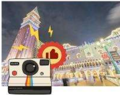
เดอะ เวเนเชียน มาเก๊า