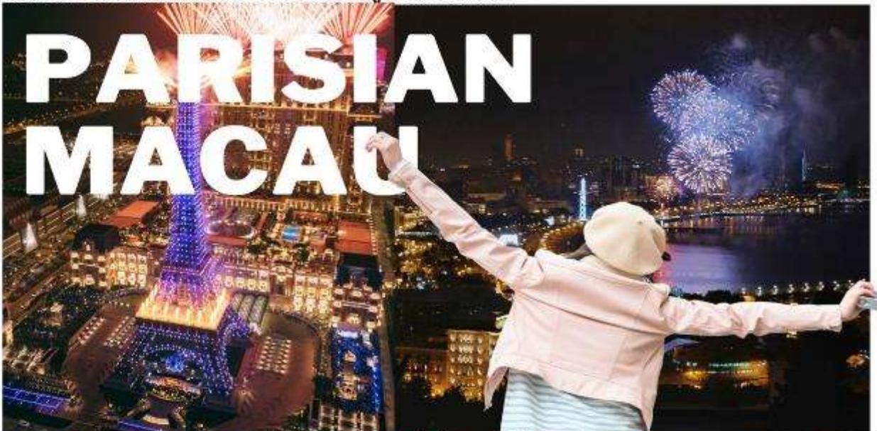
เดอะปารีสเซียน มาเก๊า

นำท่านชมความสวยงามของลาสเวกัสเอเชีย ภายในพร้อมสรรพด้วยสิ่งอำนวยความสะดวก ที่ให้ความบันเทิงและสถานที่ช้อปปิ้งต่างๆ ท่านจะพบกับร้านค้าแบรนด์เนมชื่อดังมากมายกว่า 350 ร้าน และภัตตาคารต่างๆ ให้ท่านสัมผัสกับบรรยากาศการล่องเรือเวนิสที่อิตาลี สถาปัตยกรรมเวนิสที่คลาสสิก สีสันสดใส เดอะแกรนด์คานาเล่ช้อปปิ้งที่ตั้งอยู่ใจกลางโรงแรม