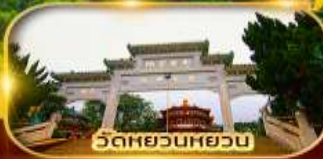
วัดหยวนหยวน