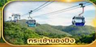
กระเช้าตองปิง