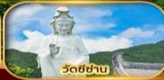
วัดซีซาบ