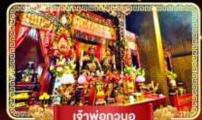
เจ้าพ่อกวนอู