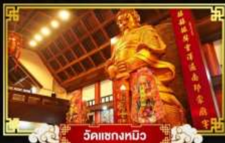
วัดแซงทิว