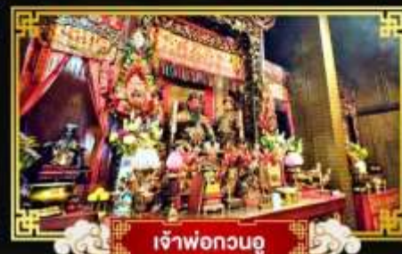
เจ้าพ่อกวนอู