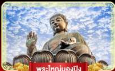
พระใหญ่นองปิง

ฟรีเปิดทองพระคลังเจ้าแม่กวนอิม บินลัดฟ้าไปมูสู่เกาะฮ่องกง