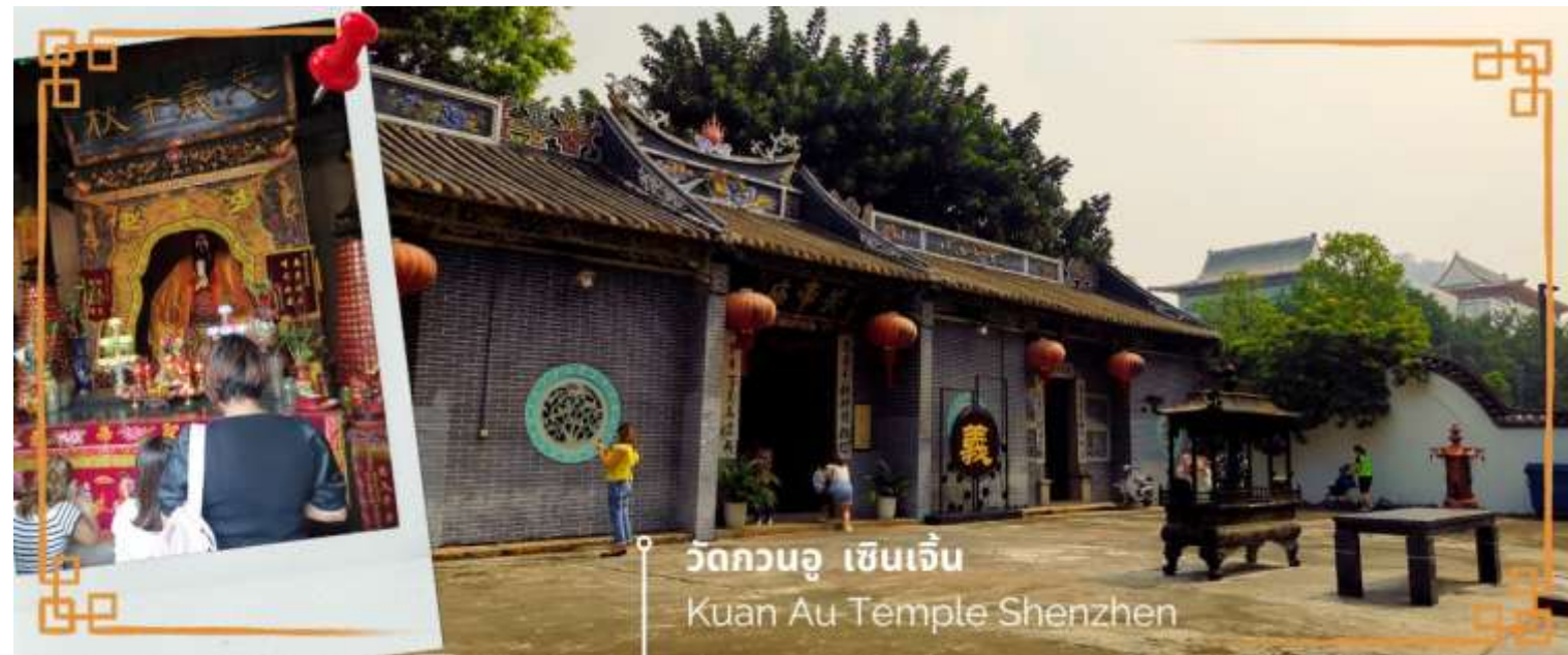
วัดกวนอู เซินเจิ้น Kuan Au Temple Shenzhen

เช้า ☉ บริการอาหารเช้า ณ ห้องอาหารของโรงแรม (3) จากนั้นนำท่านเดินทางสู่ วัดกวนอู ไหว้เทพเจ้ากวนอู สัญลักษณ์ของความซื่อสัตย์ ความกตัญญูรู้คุณ ความจงรักภักดี ความกล้าหาญ โชคลาภ และบารมี ท่านเปรียบเสมือนตัวแทนของความเข้มแข็งเด็ดเดี่ยวของอาจไม่ครั้งคร้ามต่อศัตรู ท่านเป็นคนจิตใจมั่นคงตั้งขุนเขา มีสติปัญญาเฉลียวฉลาด และไม่เคยประมาทการบูชาขอพรท่านก็หมายถึงขอให้ท่านช่วยอุดช่องว่างไม่ให้เพลิงงพล้ำแก่ฝ่ายตรงข้าม และให้เกิดความสมบูรณ์ด้วยคนข้างเคียงที่ซื่อสัตย์ หรือบิรวารที่ไว้วางใจได้นั้นเองดังนั้นประชาชนคนจีนจึงนิยมบูชา และกราบไหว้เพื่อความเป็นสิริมงคลต่อตนเอง และครอบครัวในทุกๆ ด้าน