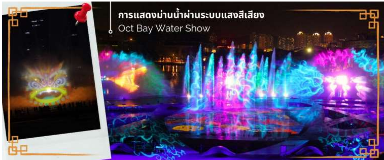
การแสดงม่านน้ำผ่านระบบแสงสีเสียง Oct Bay Water Show

โรงแรมที่พัก นำท่านเดินทางเข้าสู่ที่พัก Shenzhen Trends Luohu or Similar 3* Hotel ★★ ★ หรือเทียบเท่า วันที่สอง เซินเจิ้น - วัดกวนอู - ร้านหยก - ร้านยาสมุนไพร - บ้านหิมะ SNOW WORLD - ช้อปปิงล่อหู่