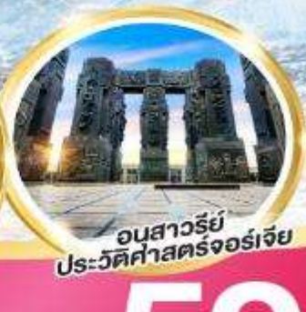
อนสาวรีย์ประวัติศาสตร์จอร์เจีย