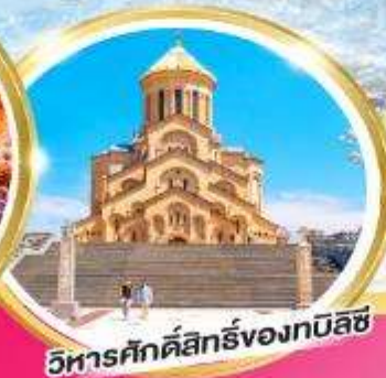
วิหารศักดิ์สิทธิ์ของทбилиซี