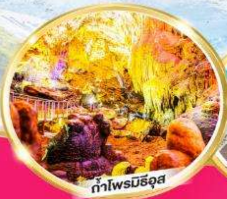
น้ำพุร้อนมูร์ซุส