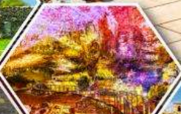
ด้าไฟรมีริอุส