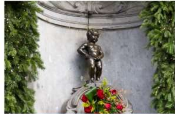
รูปปั้นแมนเนเก่นพิส

นำท่านไปชม รูปปั้นแมนเนเก่นพิส รูปปั้นเจ้าหนูน้อยที่โด่งดังอิสระให้ท่านเดินเล่นชมเมืองหรือเลือกซื้อสินค้าของเมืองอาทิ ช็อคโกแลต เบลเยี่ยมผลิตช็อคโกแลตกว่า 172,000 ตันต่อปี และมีร้านขายช็อคโกแลต กว่า 2,000 ร้าน, ฝ่าปากลูกไม้ หรือลิ้มลองวาฟเฟิลของอร่อยที่หาชิมได้ไม่ยาก