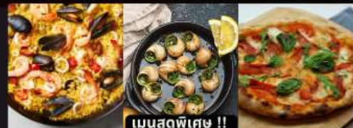
PAELLA ข้าวผัดสเปน / หอยแอสคาโก้ / พืชข่ามาการ์ต้า