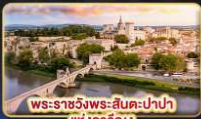
พระราชวังพระสันตะปาปา แห่งอเวัญ