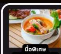
มือพิเศษ อาหารไทยในยุโรป