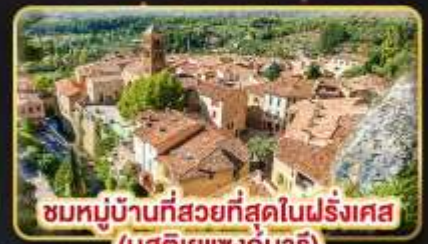
ชมหมู่บ้านที่สวยงามที่สุดในฝรั่งเศส (บูสตีเยแซงก์มารี)