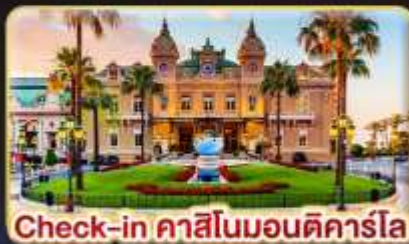
Check-in คาสีโนมอนติคาร์โล