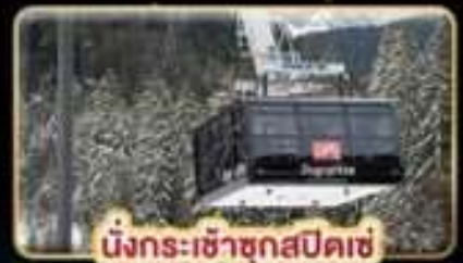
นั่งกระเช้าซุกสปีดเซ