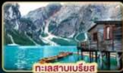
ทะเลสาบเบรียส