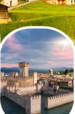
ซิริมิโอเน