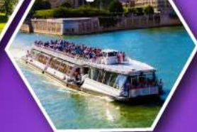
ล่องเรือบาโตมุช ชมกรุงปารีส

เที่ยวเมืองวาอุซ เมืองหลวงของสาธารณรัฐ ลิกเทินสไตน์