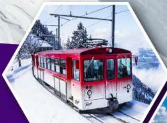
นั่งรถไฟใต้เขาริกิ