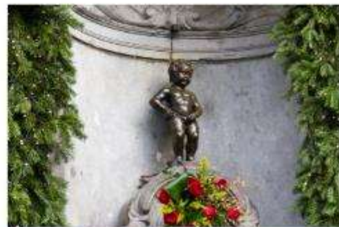
รูปปั้นแมนเนเก่นพีส